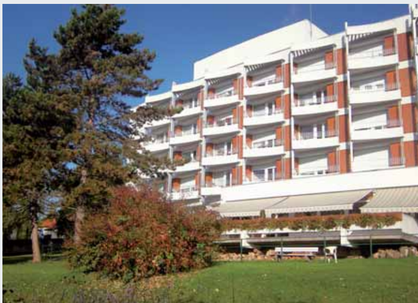
112 lieux de vie dans un magnifique parc arboré.

Des investissements importants pour le bien-être et le confort de tous les résidents ont été réalisés comme la création d'une rampe d'accès pour les personnes à mobilité réduite, la modernisation de 22 salles de bains